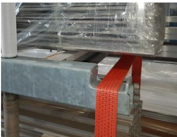
Bindelaschen für das sichere verzurren beim Transport