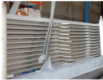
Kranhaken für ein effizientes Handling in Ihrem Betrieb