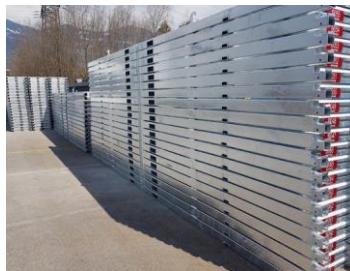
Geringer Platzbedarf für Ihre Lagerung