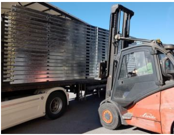
Volumenreduktion der verzinkten LGP (Transportkosten)